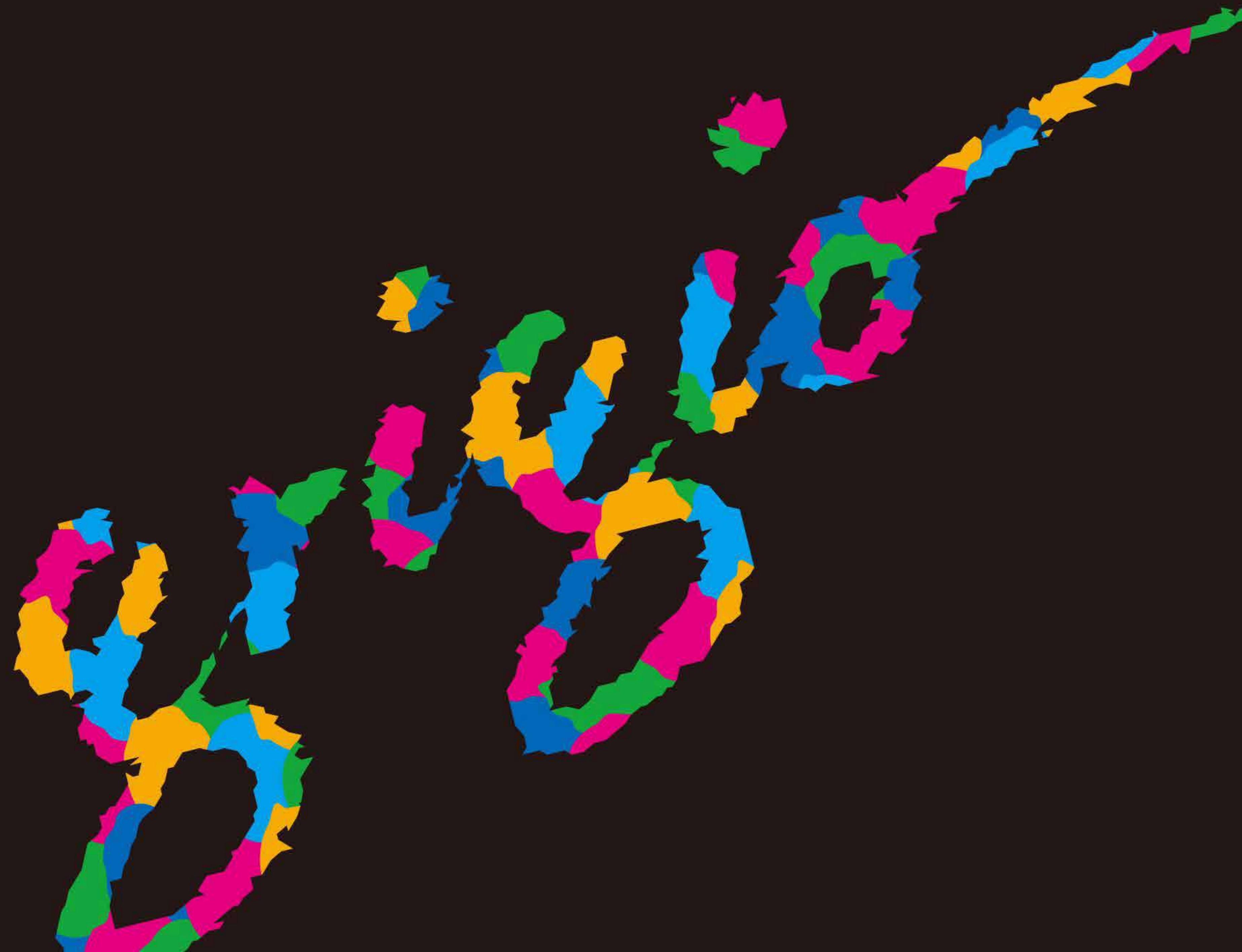
〈テイントプレイの色相環マップ〉